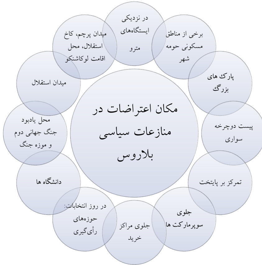
نمودار شماره ۳: مکان اعتراضات در منازعات سیاسی بلاروس