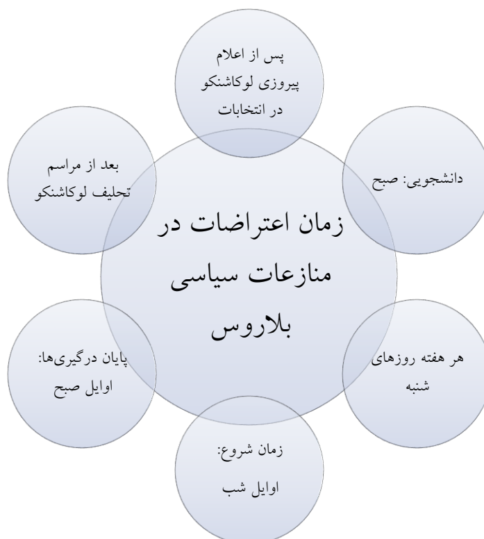
نمودار شماره ۲: زمان اعتراضات در منازعات سیاسی بلاروس

انتخاب می‌شود تا بیشترین انعکاس رسانه‌ای را داشته باشد. این الگو حتی در مناطق حاشیه‌ای نیز صدق می‌کند، جایی که تمرکز بر خیابان‌های اصلی، ساختمان‌های دولتی، مراکز خرید و سایر نقاط حیاتی است. استفاده از ابزارهای ارتباطی یکی دیگر از مؤلفه‌های مهم در سازماندهی اعتراضات، انعکاس درگیری‌ها و ارائه آمارهای مربوط به کشته‌شدگان، مجروحان، دستگیرشدگان و مفقودشدگان است. این ابزارها معمولاً مشابه هستند، مگر آنکه با پیشرفت تکنولوژی، ابزارهای جدیدی وارد میدان شوند. نکته آخر، استفاده مخالفان از نمادها برای تقویت پیام‌هایشان است. استفاده از رنگ‌ها، گل‌ها، کلاه‌ها، چترها و همچنین خواندن سرودهای ملی یا شعارهای خاص، از جمله مواردی هستند که به عنوان نمادهای اعتراضات به کار گرفته می‌شوند و به جنبش‌ها هویت و انسجام می‌بخشند.