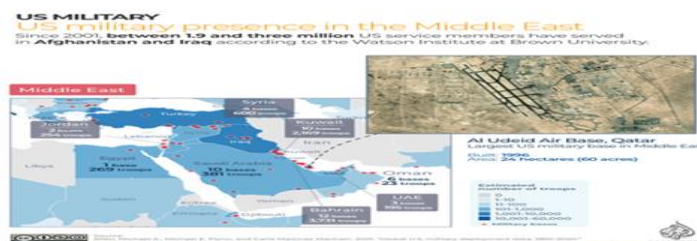
تصویر شماره (۱): پایگاه‌های آمریکا در منطقه‌ی خاورمیانه.