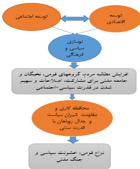
شکل ۲. الگوی هائینگتون برای ظهور خشونت سیاسی