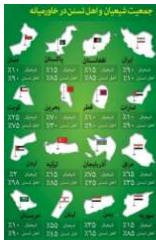
اینفوگرافی ۱. وضعیت مذهبی خاورمیانه

پیشرفت ایران در حوزه‌های مختلف و ایستادگی در مقابل سلطه‌گران نیز از فرصت‌ها و ابزارهای دیگر توسعه ژئوپلیتیک شیعه از لحاظ جغرافیایی است. در این میان، ظرفیت‌های جغرافیایی شیعه از خلیج فارس به سمت دریای سرخ، باب المندب و مدیترانه رو به گسترش و توسعه خواهد بود. با بروز تحولات در منطقه، ایران توانست نفوذ منطقه‌ای خود را در قالب گفتمان مقاومت افزایش دهد و طرح‌های آمریکا و رژیم صهیونیستی برای بازترسیم نظم منطقه‌ای مورد نظر خود را به چالش بکشاند.