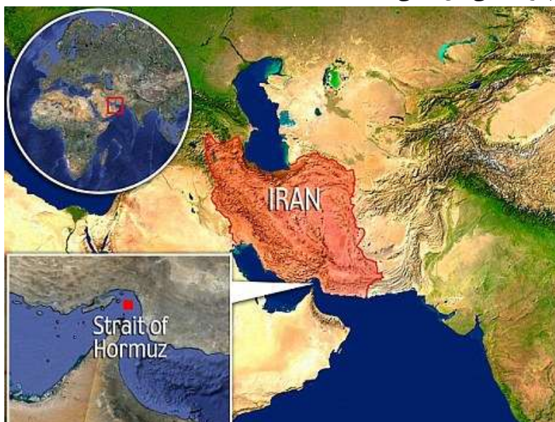
نقشه ۲. جایگاه راهبردی ایران در خاورمیانه

کشورها در عرصه روابط بین‌الملل، براساس ظرفیت‌های اعمال قدرت، به گسترش حوزه نفوذ و افزایش نقش در منطقه یا مناطق پیرامونی خود علاقه‌مند هستند. از جمله حوزه‌های ژئوپلیتیک حساس پیرامون ایران، منطقه غرب آسیاست؛ از این رو ایران می‌تواند با داشتن نقش محوری در گستره جغرافیایی شیعیان و سرزمین‌های شیعه نشین در این منطقه، نقش بسزایی در قلمرو خواهی و گسترش علایق منطقه‌ای ایفا کند. پیرو چنین نگرشی، توجه کشور ما باید به سوی ماورای مرزهای خود و مناطقی از غرب آسیا معطوف شود که با داشتن درصد فراوانی از جمعیت شیعه، از لحاظ کمی و موقعیت ژئوپلیتیک از نظر کیفی در منطقه از جایگاه ممتازی برخوردارند. بی‌شک چنین موقعیتی می‌تواند ایران را