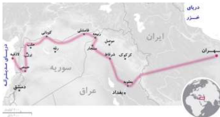
نقشه ۴. مسیر شمالی کریدور زمینی تهران-مدیترانه

۱. ایران با ایجاد چنین کریدوری می‌تواند دسترسی خود را تا سواحل مدیترانه گسترش دهد و بستر انتقال نیرو و تسلیحات در نزدیکی مرزهای رژیم صهیونیستی را فراهم کند. این موقعیت ژئواستراتژیک بی‌اندازه ارزشمند، توانایی تهران برای تهدید رژیم صهیونیستی، اردن و متحدان آمریکا را تقویت می‌کند. ۲. ایران با در پیش گرفتن سیاست تعمیق عمق راهبردی در ماورای مرزهای خود با راهبرد دسترسی فعال می‌تواند علاوه بر تأمین نیازهای امنیتی در پروژه‌های مهم اقتصادی - که راهی مؤثر برای رهایی از تحریم‌های همه جانبه است - مشارکت کند. حضور در بازسازی مناطق جنگ زده، بازسازی کارخانه‌های تخریب شده و احداث زیرساخت‌های آسیب دیده در کشورهای عراق و سوریه از مهم‌ترین ابزارهایی است که کشور ما می‌تواند به کمک آن دامنه حضور خود در این کشورها را افزایش دهد (کریمی، ۱۳۹۶: ۱۱).